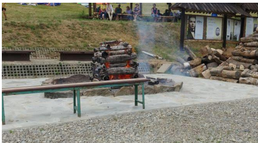
Watra została rozpalona

Tegoroczny program był bardzo bogaty. Na scenie wystąpiło 40 zespołów z Polski, Ukrainy, Serbii i Słowacji. Oto kilka koncertujących zespołów: z Polski – Horpyna, Osławiany, Kyczera, z Ukrainy –