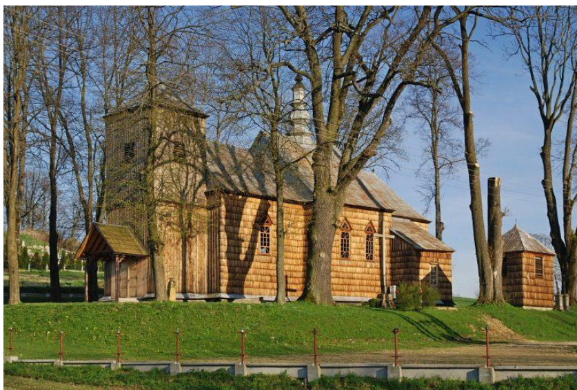
Cerkiew p.w. św. Paraskewii