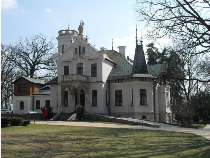
Pałac w Oblęgorku