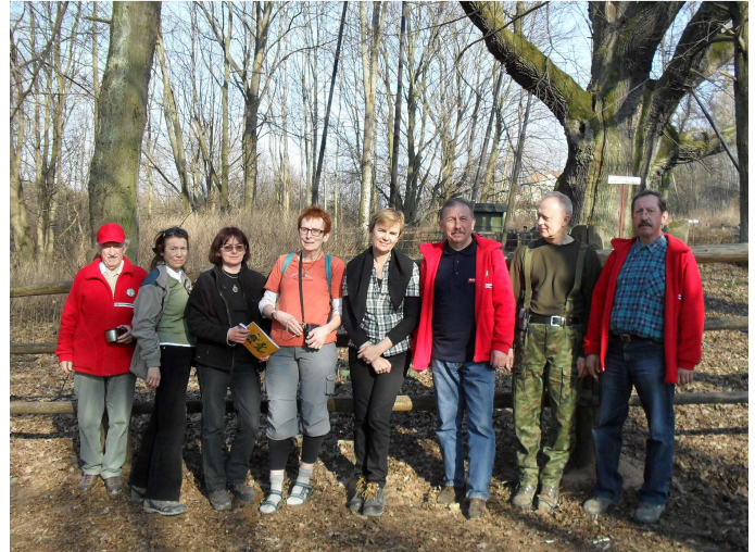
W pełnym składzie pod „Bartkiem”

Przebywając na tych terenach trzeba jeszcze odwiedzić malowniczo położoną w gminie Strawczyn wieś Oblęgorek. Miejsce zamieszkania naszego noblisty Henryka Sienkiewicza. Obecnie znajduje się tam muzeum. Majątek w Oblęgorku został ufundowany przez polskie społeczeństwo i przekazany pisarzowi w dowód uznania w 25-tą rocznicę jego pracy literackiej. W pomieszczeniach muzeum można obejrzeć wystawę książek pisarza, oryginalne meble i obrazy. Ten XIX-wieczny pałacyk otoczony jest przepięknym parkiem wysadzonym głównie starymi dębami i lipami.