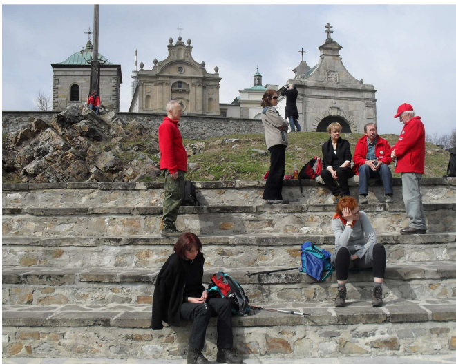
Klasztor „Święty Krzyż”

Następnie zwiedziliśmy jedną z najbardziej znanych atrakcji turystycznych Gór Świętokrzyskich i jedną z najpiękniejszych jaskiń krasowych naszego kraju – jaskinię „Raj”. Od 1972 roku udostępniona jest dla ruchu turystycznego wyłącznie pod opieką przewodnika. Zachwyca bogactwem form naciekowych. Występują tutaj skupiska stalaktytów o unikatowym na skalę światową zagęszczeniu.