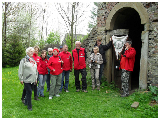
Łodzianie już poZjeździe

Zjazd Delegatów odbył się zgodnie z zapowiedzią w ośrodku Rehabilitacyjno –