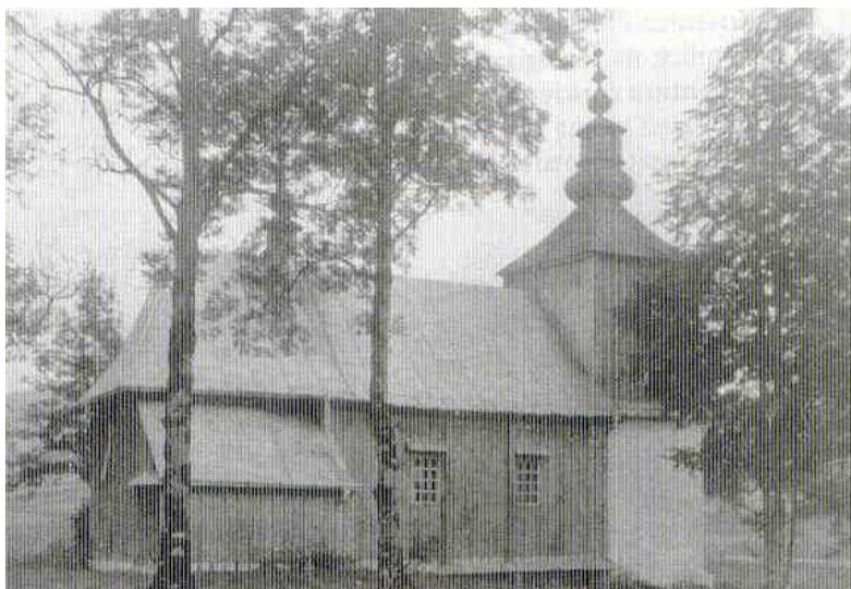
Balnica. Cerkiew filialna z 1856 r