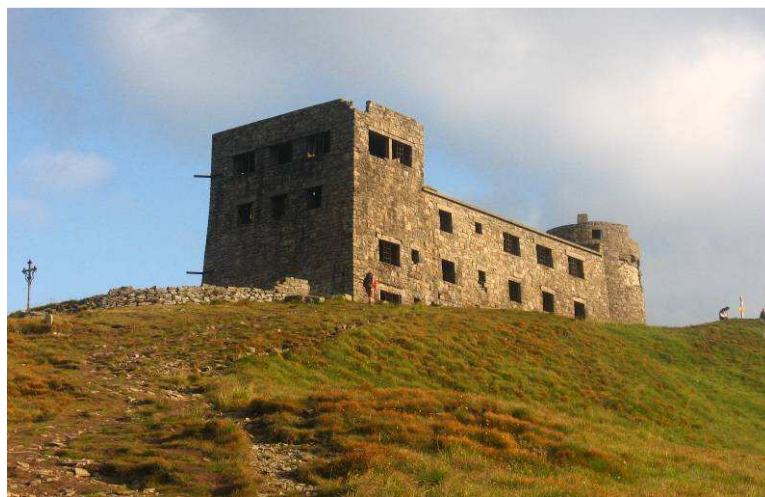
Obserwatorium w sierpniu 2009 roku

Po wojnie budowla niszczała. Ukraiński portal Gazeta.ua pisał, że miedziany dach byłego obserwatorium nadal służy miejscowym Hucułom: został przerobiony na kotły, w których pasterze warzą ser na połoninach.