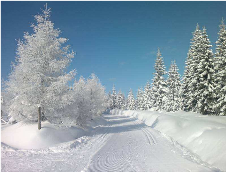
„Izerski Szlak Cietrzewia” do Chatki Górzystów