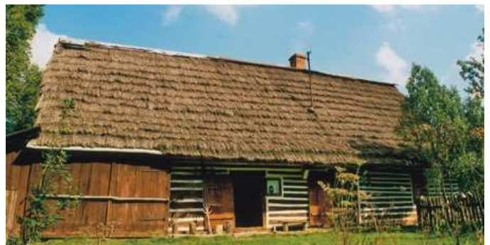
Chyża w Olchowcu