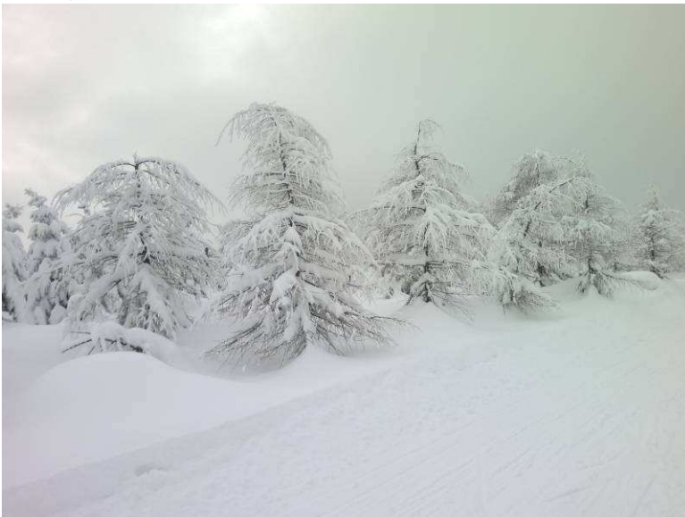
Po prostu pięknie